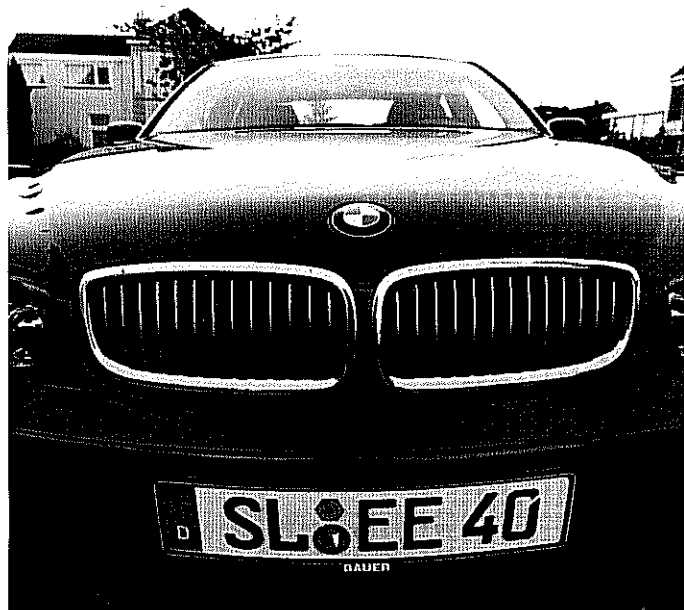
Fiscus moet minder belasting heffen over leaseauto's uit het buitenland

Een bolide leasen in het buitenland is door een maas in de wet vooralsnog financieel voordelig